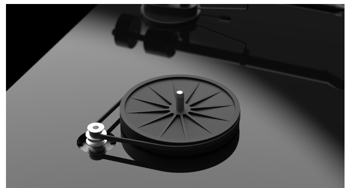
Besonders präzise Motor- und Subplatter-Konstruktion

Durch all diese sich entwickelnden Marktkräfte bleibt die ursprüngliche Mission von Pro-Ject jedoch bestehen. Wir sind immer noch bestrebt, neue Plattenspieler zu liefern, die in ihrer musikalischen Ausstrahlung erstklassig klingen. Wir sind aber auch offen für Anpassungen an einen sich wandelnden Lebensstil unserer Kunden und stellen sicher, dass das, was wir neu entwickeln immer über die Funktionen, das Aussehen und die Annehmlichkeiten verfügt, die es einem leicht machen, das Produkt als neuen Plattenspieler anzunehmen.